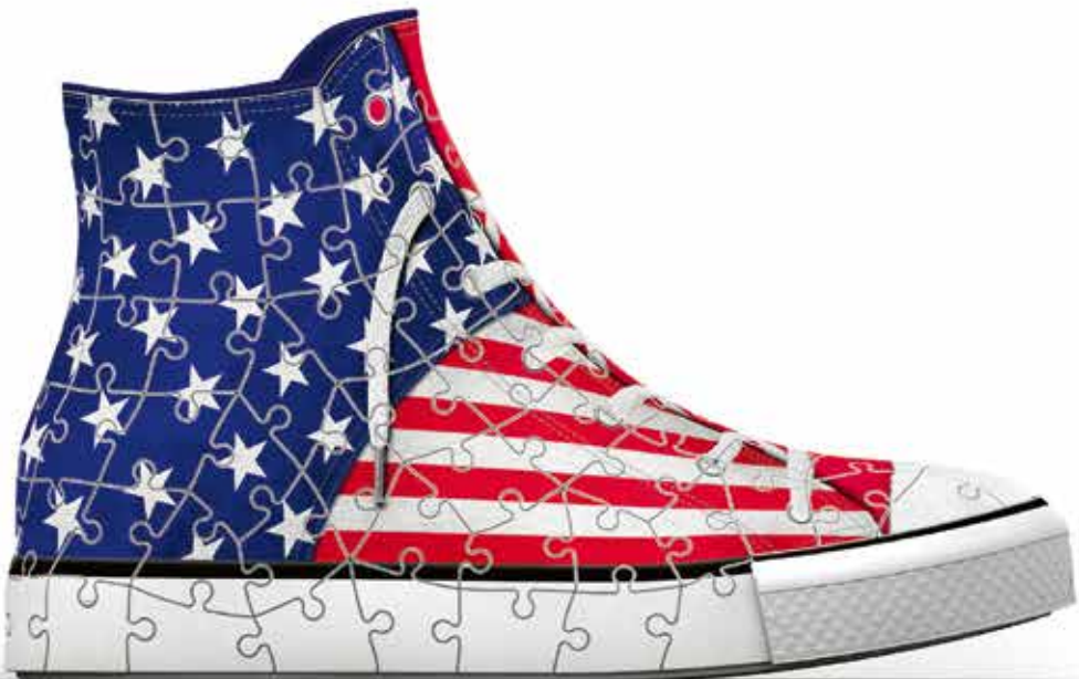
No. 12 549 4