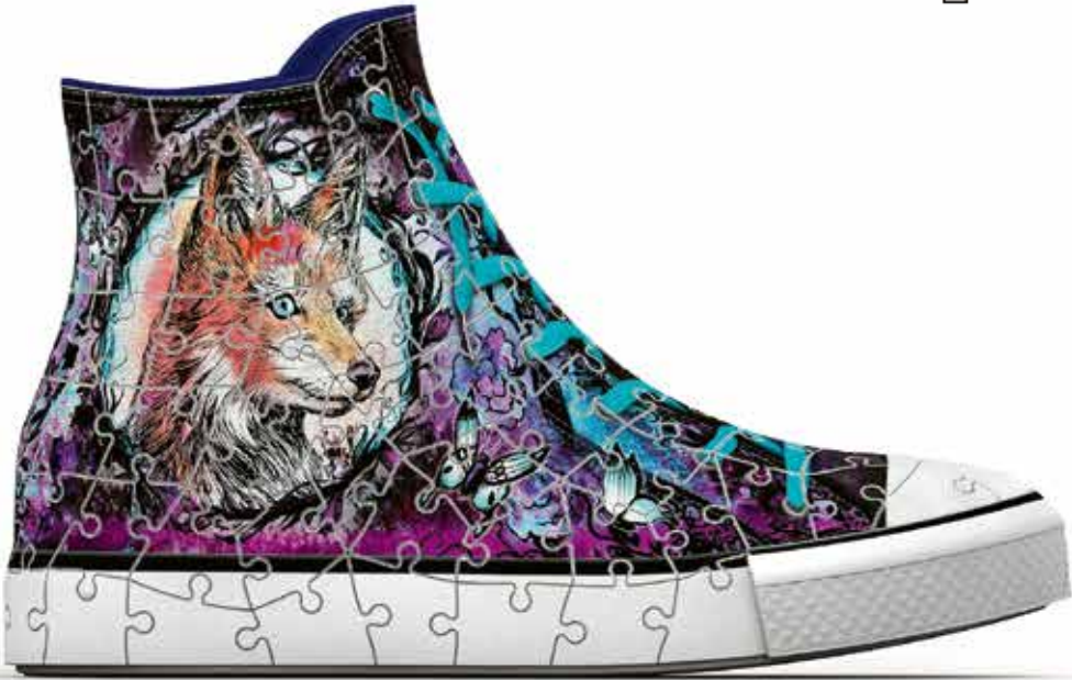
No. 12 085 7